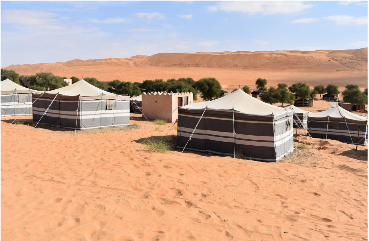
1001 Desert Night Camp