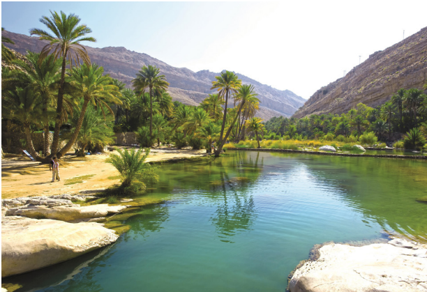
Wadi Bani Khalid