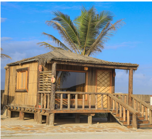
Souly Eco Lodge, Salah