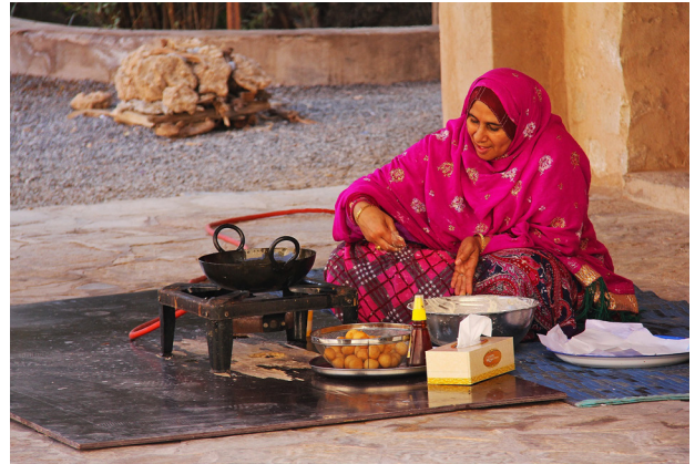
Wildcampen in der Wüste