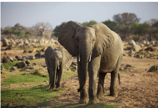
Unterwegs auf Safari im Ruaha Nationalpark