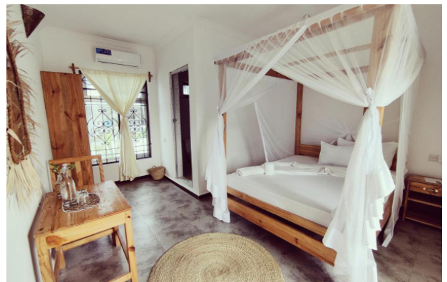
Hakuna Matata Beach Hotel, Zanzibar