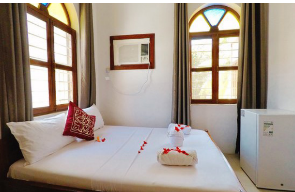
Shangani Hotel, Stonetown