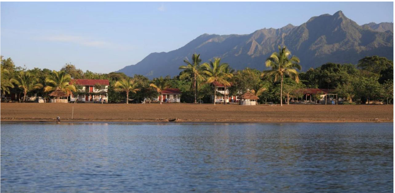
Matema Lake Shore Resort, Malawisee