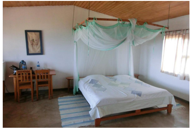
Zimmer im Matema Lake Shore Resort, Malawisee