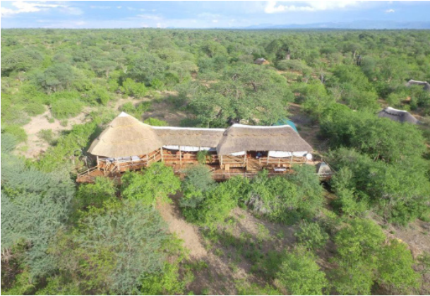
Ruaha Hilltop Lodge, Ruaha Nationalpark