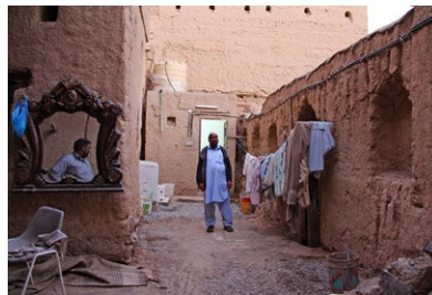
Begegnungen im Hajargebirge