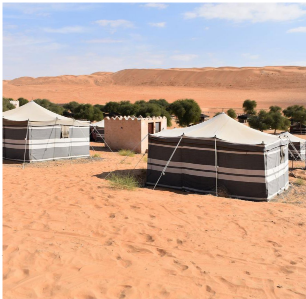
Wüstencamp, Wahiba Sands