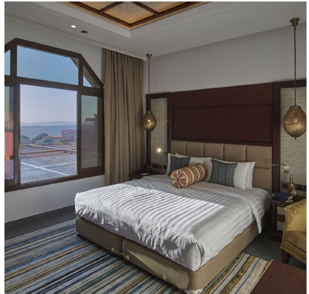
Unterkunft Jebel Akhdar