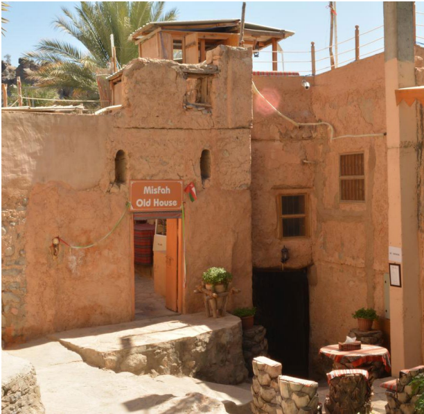
Guesthouse, Misfah Al Abriyyin