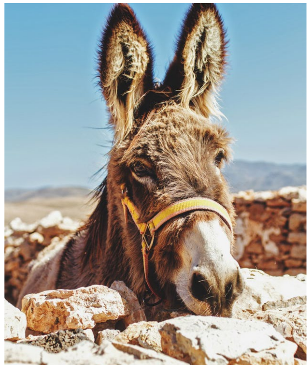
Treuer Trekkingbegleiter im Hajargebirge