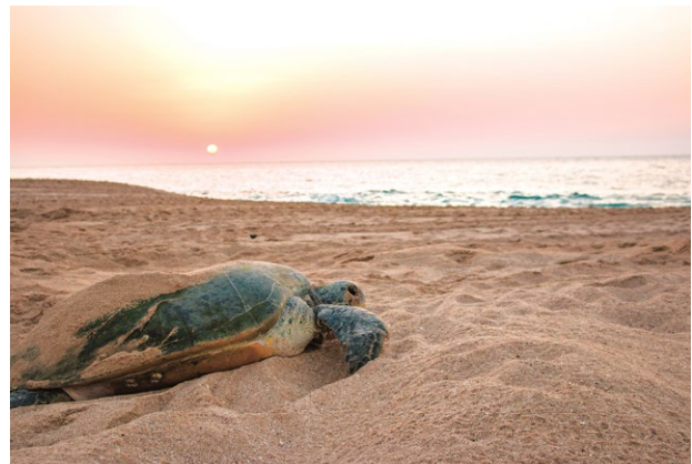
am Turtle Beach, Ras al Jinz