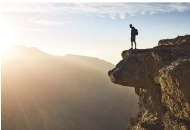
Wanderung im Hajargebirge