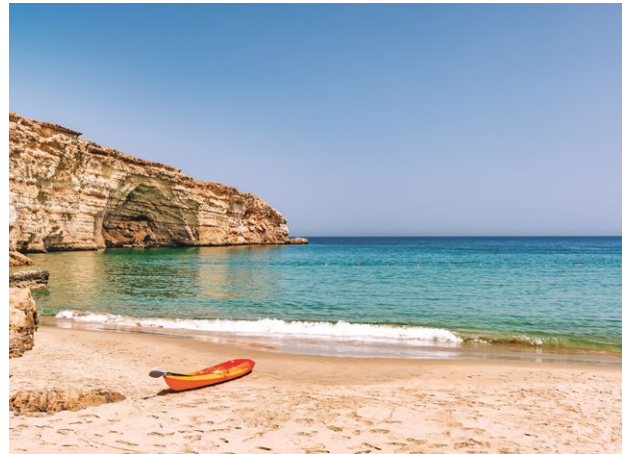
Küstenlandschaft auf dem Weg zurück nach Muscat

F = Frühstück / M = Mittagessen / A = Abendessen