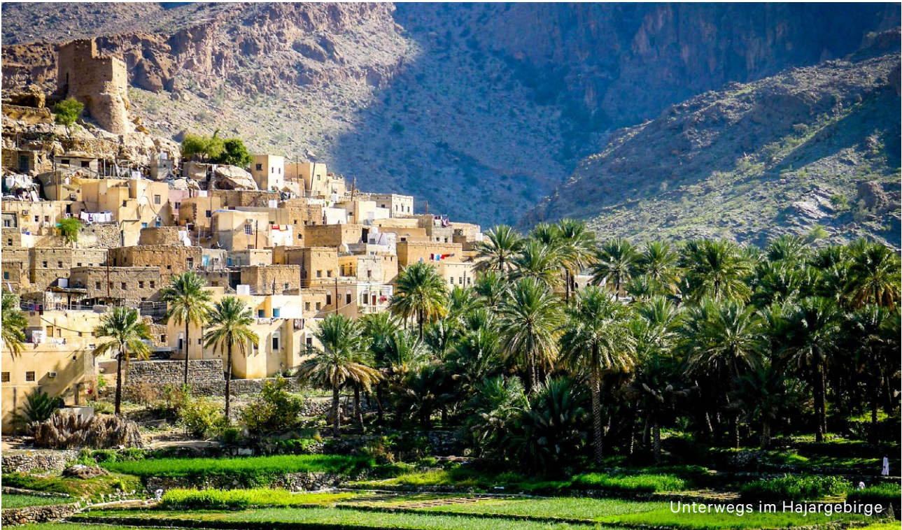
Unterwegs im Hajargebirge

Eine Reise zu abgelegenen Bergdörfern, Sanddünen und Wadis