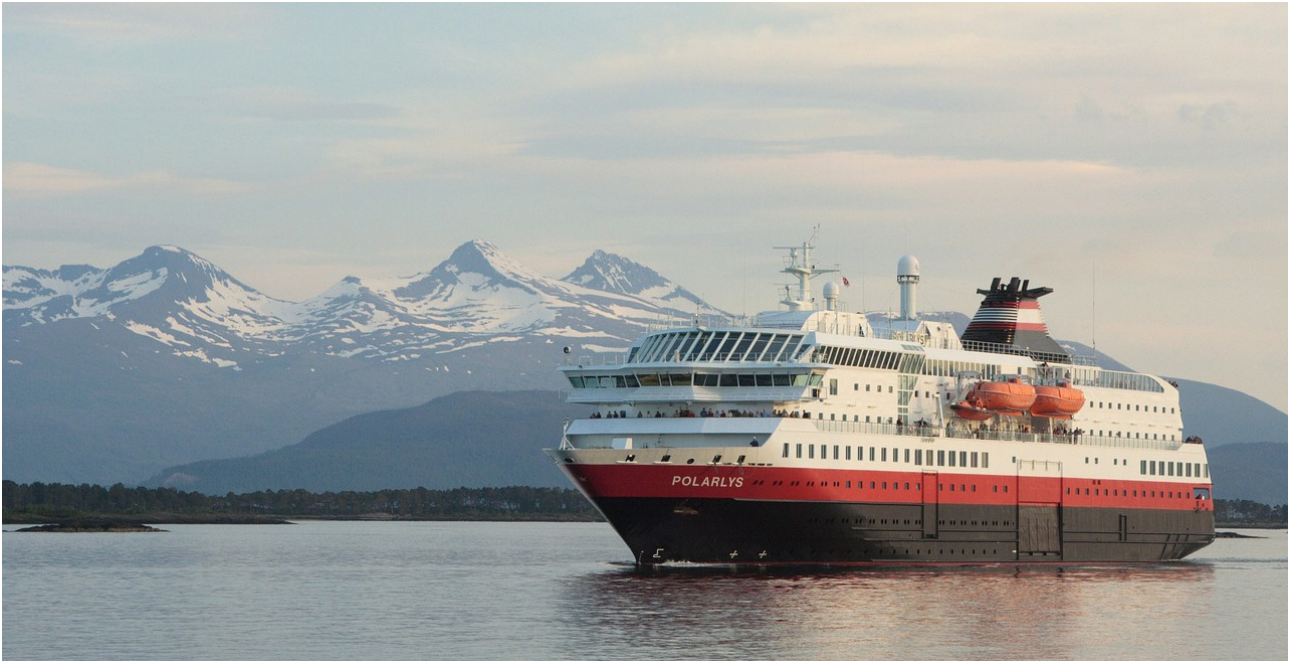
Ein Schiff der Hurtigruten