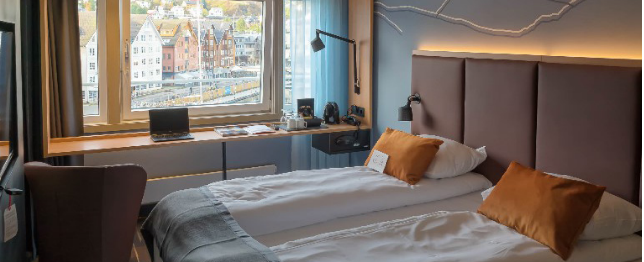
Hotel in Tromsø