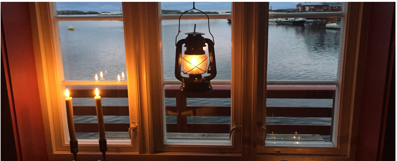
Blick aus dem Rorbu