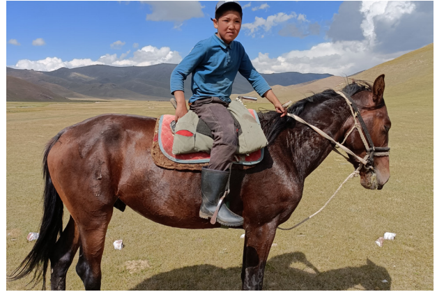
Die Kinder in Kirgistan können schon sehr früh reiten