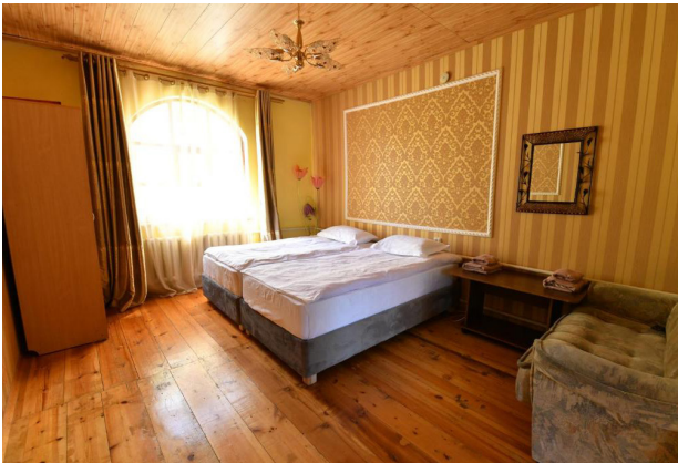
Zimmer in Karakol