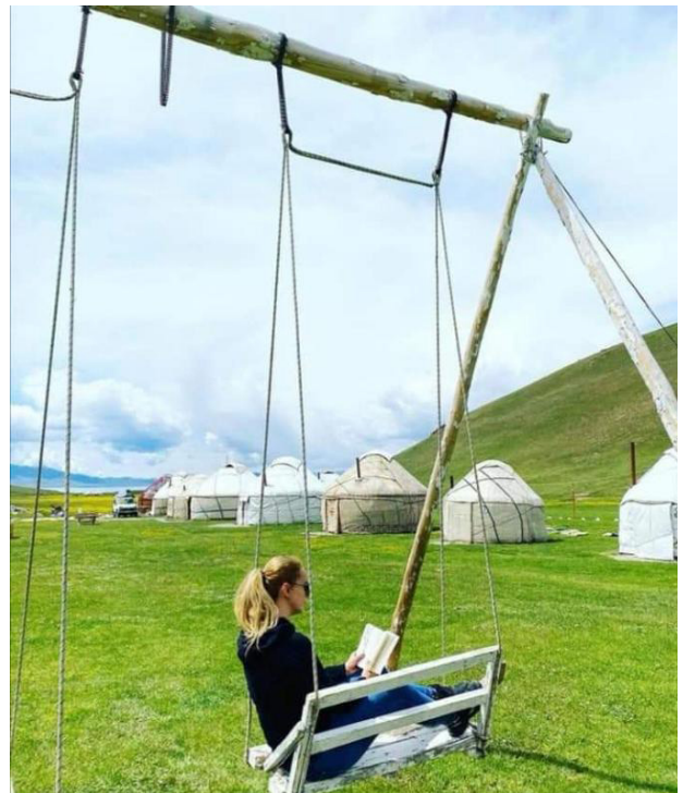
Entspannung im Jurtencamp am Song-Kul

F = Frühstück / M = Mittagessen / A = Abendessen