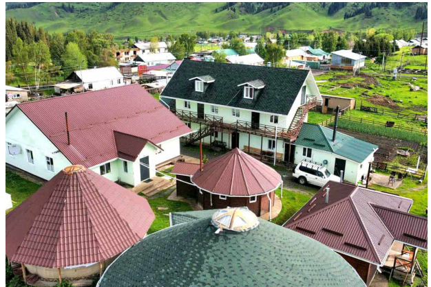
Unterkunft mitten im Dorf Jyrgalan