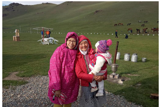
Begegnung mit den Einheimischen in den Jurtencamps

Nach dem Frühstück verlassen wir die imposanten Berge und fahren wieder hinunter nach Bischkek. Am Abend Besuch von einem lokalen Restaurant. Übernachtung im Hotel mit Swimmingpool ( Asia Mountain o.ä.).