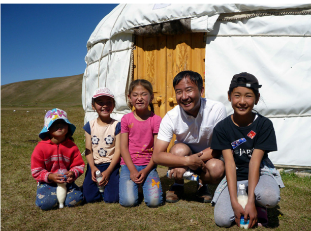
In den Sommermonaten findet das Leben der Kinder draussen statt