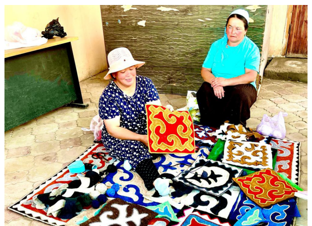
In der Filzkooperative in Kochkor