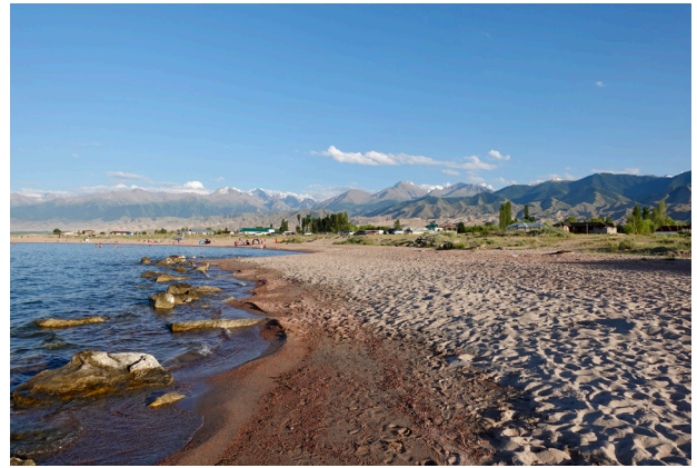
Strand gleich beim Jurtencamp in Tosor