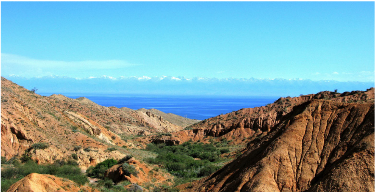
Blick auf den Issyk-Kul vom Skazka-Canyon aus