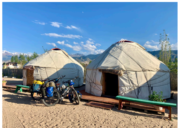
Jurtencamp am Issyk-Kul