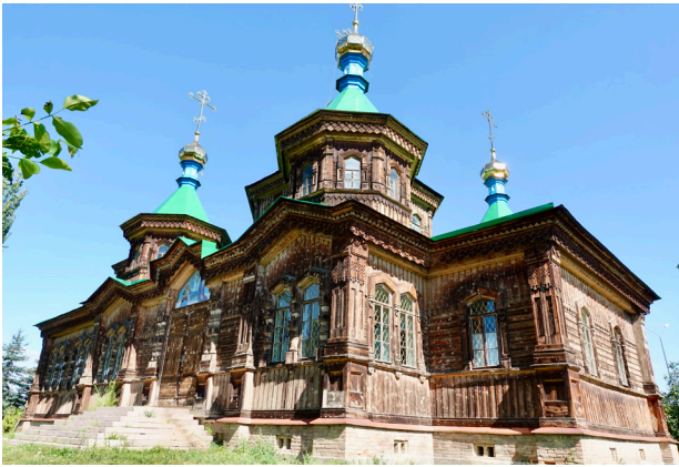
Die russisch-orthodoxe Kirche in Karakol