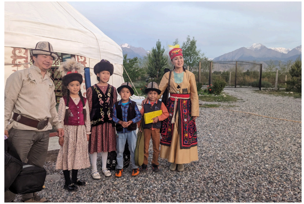
Hüte spielen in Zentralasien eine grosse Rolle

Heute geht es zu Fuss oder mit Pferd auf Erkundungstour dem See entlang, wo sich viele Jurten und noch viel mehr Tiere befinden. Pferde soweit das Auge reicht. Falls möglich, organisieren wir für heute ein Kok Boru , ein traditionell nomadisches Reitspiel, das ziemlich archaisch anmutet. Wer möchte darf der Gastfamilie bei der Zubereitung vom traditionellen Mittagessen helfen. Letzte Übernachtung in der gemütlichen Jurte.