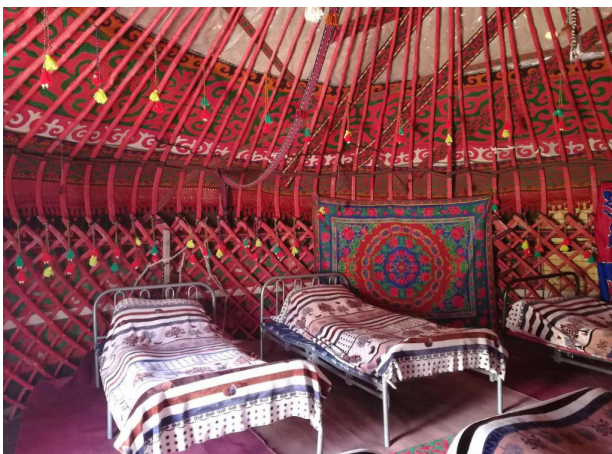
Unvergessliches Erlebnis: Übernachten in einer Jurte