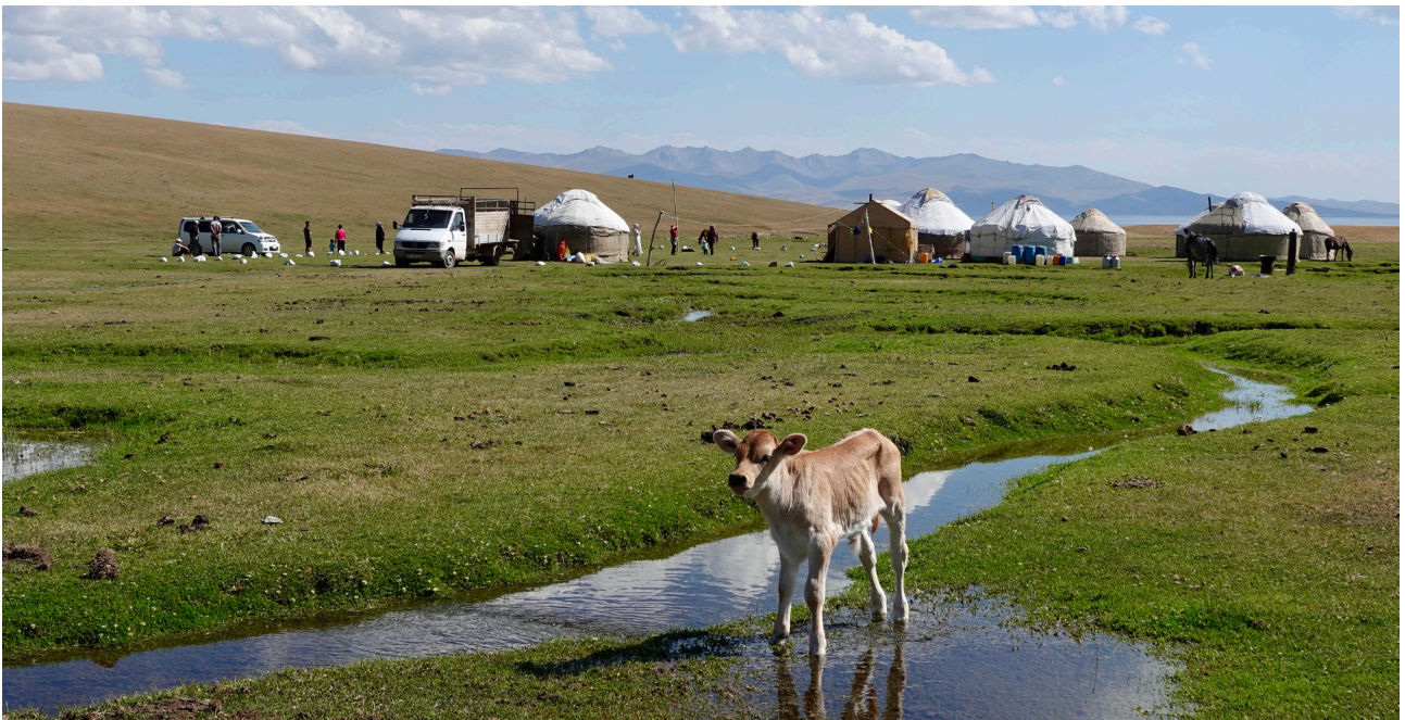
Alltag am Song-Kul