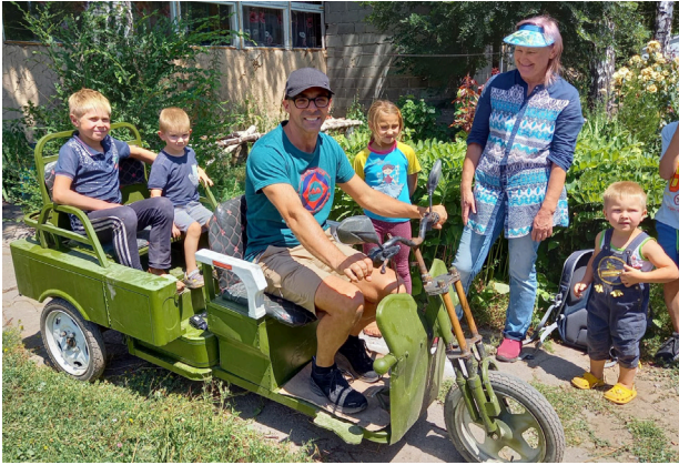
Spass für alle unterwegs