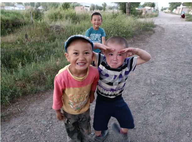
Die einheimischen Kinder freuen sich immer, ihr Englisch zu üben und fragen gerne nach Bonbons