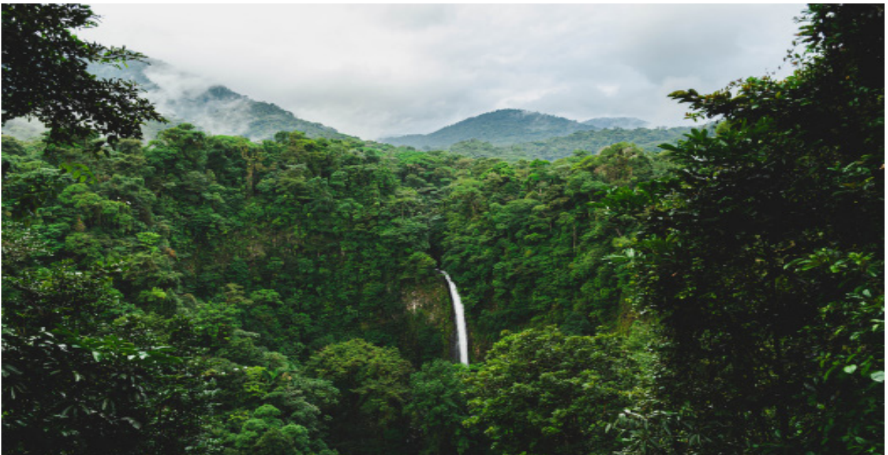
La Fortuna Wasserfall